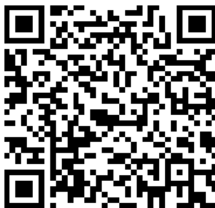
安卓版本扫描二维码